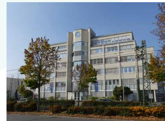
Standort Borsigallee Sitz der Institus- ambulanz und der TagesReha.