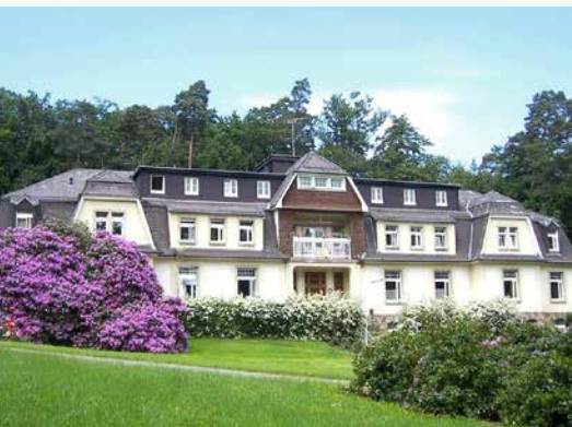
Haus Altkönig, idyllisch gelegenes Domizil einer der beiden Stationen für Suchtmedizin.

Borsigallee 19 60388 Frankfurt Telefon 069 244 323-2100 Telefax 069 244 323-2110 sucht@tagesreha-ffm.de