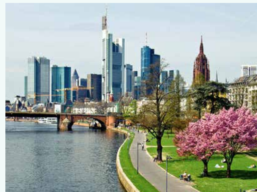
Skyline Frankfurt, seit 2000 ist die Klinik Hohe Mark in Frankfurt präsent.