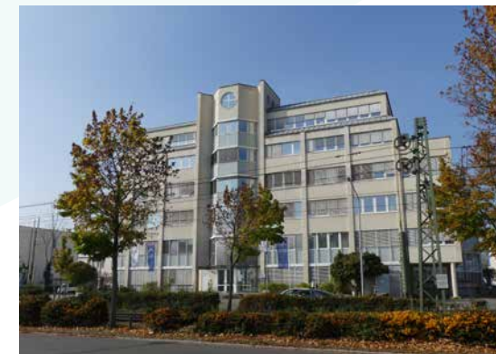
Standort Borsigallee Sitz der Instituts- ambulanz und der TagesReha.