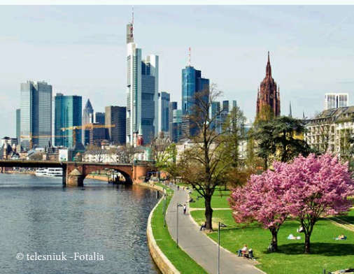
Skyline Frankfurt, seit 2000 ist die Klinik Hohe Mark in Frankfurt präsent.