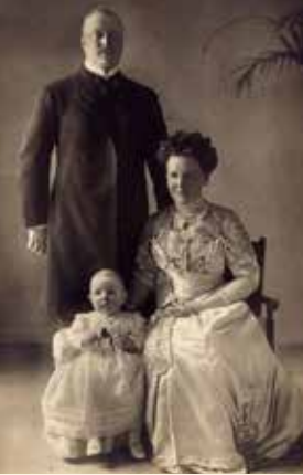
Wilhelmina von Oranien-Nassau von 1890 bis 1948 Königin der Niederlande mit Tochter Juliana und Prinzgemahl Heinrich zu Mecklenburg.