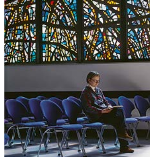
Blick in den Kirchsaa mit Buntglasfenster von Alexander Iwschenko (1964/65, Freie Komposition)