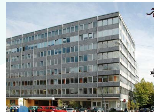
Standort Burgstraße Sitz der Instituts- ambulanz und der TagesReha.

Burgstraße 106 60389 Frankfurt am Main Telefon 069 244 323-2100 Telefax 069 244 323-2110 sucht@tagesreha-ffm.de