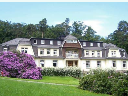
Haus Altkönig, idyllisch gelegenes Domizil der Station für Suchtmedizin.

Friedländerstraße 2 61440 Oberursel Telefon 06171 204-0 Telefax 06171 204-8000 klinik@hohemark.de www.hohemark.de